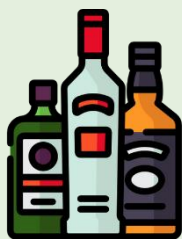
Consommation à risque élevé

Taux d'hospitalisation entièrement attribuable à l'alcool supérieur à celui de l'ensemble de l'Ontario.